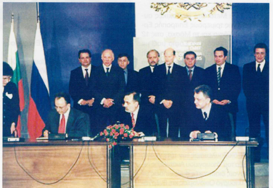
Στις 12 Απριλίου του 2005, υπεγράφη μνημόνιο συνεργασίας για την προώθηση της κατασκευής του πετρελαιαγωγού, ενώ συμφωνήθηκε οι εμπλεκόμενες εταιρείες να επιταχύνουν τις διαδικασίες για την επικαιροποίηση των αναγκαίων μελετών σκοπιμότητας.

Το μεγάλο διεθνές ενδιαφέρον για το έργο αυτό οφειλόταν στο ότι ο αγωγός