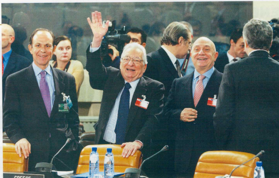
Όπως αποκαλύπτει ο κ. Σιούφας, το θέμα του αγωγού εξετάστηκε σε ειδική σύσκεψη, το Μάρτιο του 2004, μόλις λίγες ημέρες μετά την ανάληψη της ευθύνης της διακυβέρνησης της χώρας, με τον τότε πρωθυπουργό Κώστα Καραμανλή και τον τότε υπουργό Εξωτερικών Πέτρο Μολυβιάτη (πάνω φωτογραφία).

■ Έκτο: Το 2006, είχα μαζί με τον επικεφαλής της ελληνικής αντιπροσωπείας στις τριμερείς διαβουλεύσεις τον τότε γενικό γραμματέα του Υπουργείου Ανάπτυξης Νίκο Στεφάνου, διαδοχικές συναντήσεις με τον τότε υπουργό Οικονομίας και Ενέργειας της Βουλγαρίας Rumen Oncharof, τον Victor Khristenko και τον επικεφαλής της ρωσικής αντιπροσωπείας –και τον σημε-