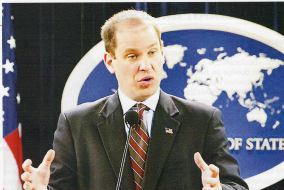
Ο εκπρόσωπος του υπουργείου Εξωτερικών των Η.Π.Α Σ. Μακ Κόρμακ είχε ευθέως δηλώσει, στις 15 Μαρτίου του 2007, ότι ο αγωγός Μπουργκάς–Αλεξανδρούπολη συνεισφέρει στη διαφοροποίηση των πηγών και οδών ενέργειας.

■ Έκτο: την έναρξη των διαβουλεύσεων με τη βουλγαρική κυβέρνηση (συνάντησή μου με τον κ. Οφτσάροφ στη Σόφια τον