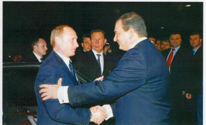
Ο πρόεδρος της Ρωσίας Β. Πούτιν κατά την υποδοχή του στον αερολιμένα «Ελ. Βενιζέλος» από τον τότε υπουργό Ανάπτυξης Δημ. Σιούφα και κατά την είσοδό του, στο Μέγαρο Μαξίμου, με τον Κ. Καραμανλή.

Μαρτίου του 2007, που δήλωσε ευθέως ότι ο αγωγός Μπουργκάς-Αλεξανδρούπολη συνεισφέρει στη διαφοροποίηση πηγών και οδών ενέργειας. Βεβαίως δεν θα πρέπει να παραγνωρίζουμε ότι στον αγωγό C.P.C, μέσω του οποίου μεταφέρονται πετρέλαια από το Καζακστάν και τη Ρωσία στα τέρμιναλς του Νοβοροσίσκ στη Μαύρη Θάλασσα, ο αμερικανικός κολοσσός Chevron είναι εκ των βασικών μετόχων από την πρώτη φάση έως σήμερα. Επιπλέον, σας υπενθυμίζω ότι αμέσως μετά τη συνάντηση του επιτρόπου Πίμπαλγκς, στις 13 Απριλίου του 2007, στην Αθήνα με τον τότε πρωθυπουργό Κώστα Καραμανλή παρουσία μου, σε δημόσια δήλωσή του τόνισε κατά λέξη: «επίσης ενθαρρύνω την Ελλάδα θερμά να συνεχίσει τη διαφοροποίηση των πηγών ενέργειας, όχι μόνο για την Ελλάδα, αλλά συνολικά για την Ευρώπη. Είναι μεγάλη επιτυχία η εξέλιξη του αγωγού Μπουργκάς – Αλεξανδρούπολη, όπως επίσης και ο interconnector με τη Τουρκία και την Ιταλία».