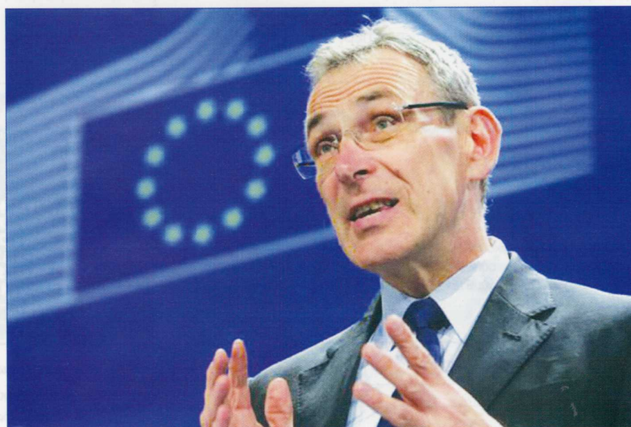
Ο Επίτροπος Ενέργειας Α. Πίμπαλγκς ενθάρρυνε τη χώρα μας «να συνεχίσει τη διαφοροποίηση των πηγών ενέργειας, όχι μόνο για την Ελλάδα, αλλά συνολικά για την Ευρώπη», υπογραμμίζοντας ότι «ήταν μεγάλη επιτυχία η εξέλιξη του αγωγού Μπουργκάς–Αλεξανδρούπολη, όπως επίσης και ο interconnector με τη Τουρκία και την Ιταλία».

Η ακατανόητη στάση της βουλγαρικής πλευράς, μετά το 2010, δεν θα πρέπει να αποτελέσει λόγο και αιτία για την οριστική ματαίωση του έργου. Η νέα ελληνική Κυβέρνηση που θα προκύψει από τις προσεχείς εθνικές εκλογές οφείλει να αναλάβει και άμεσα πρωτοβουλίες για την επανέναρξη διαβουλεύσεων με τις κυβερνή-