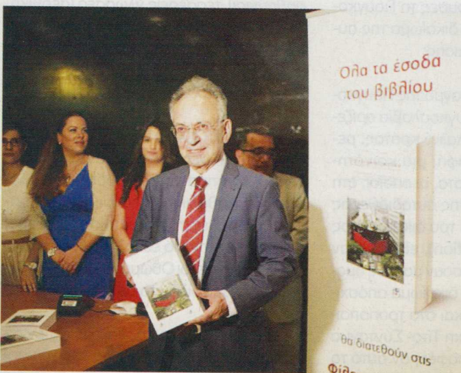
Ο πρώην Πρόεδρος της Βουλής -και συγγραφέας ενός ακόμη πολυσέλιδου έργου- Δημ. Σιούφας.

Προς αντιμετώπιση δε του βάρους των πολλών λεπτομερειών, πέραν της σωστής κεφαλαιοποίησης και του χρήσιμου ονομαστικού ευρετηρίου, το δεύτερο μέρος του βιβλίου είναι σε δίσκο CD.