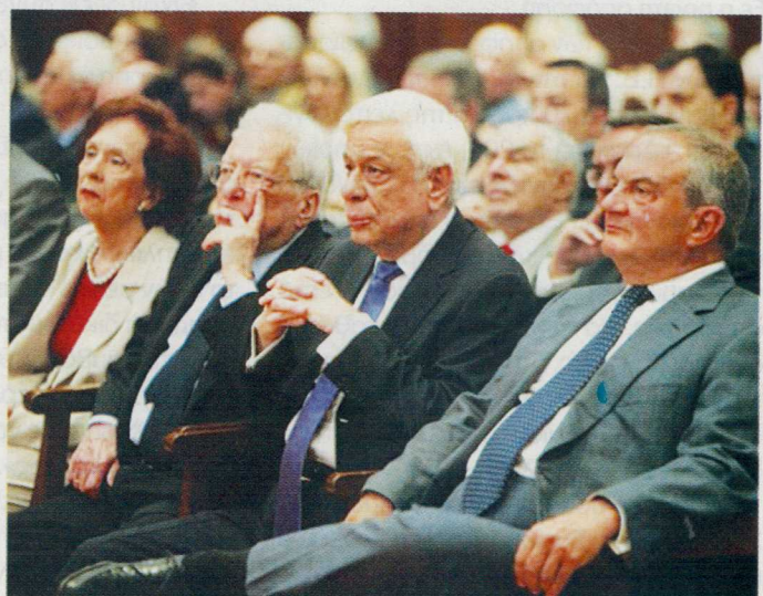
Ο Πρόεδρος της Δημοκρατίας, καθηγητής Προκόπης Παυλόπουλος, εν μέσω του πρώην πρωθυπουργού Κώστα Καραμανλή και του πρώην υπουργού Εξωτερικών, πρέσβη Πέτρου Μολυβιάτη.